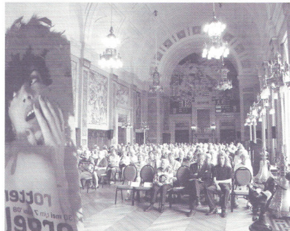
Een aandachtig publiek in de Burgerzaal van het Rotterdams stadhuis